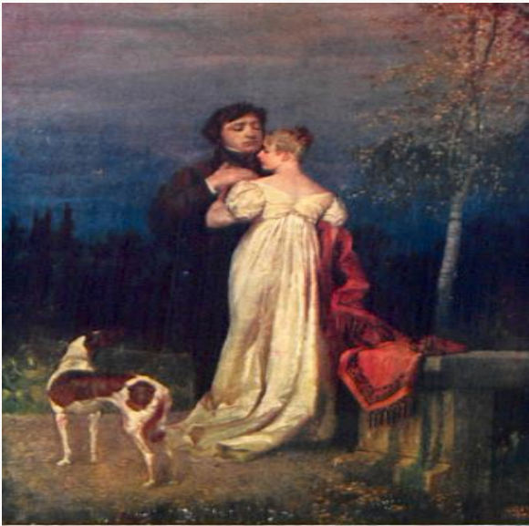
Tomasz Łosik pinx.